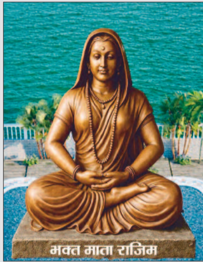
भवत माता राजिम

छत्तीसगढ़ की विष्णुदेव साय सरकार के वित्त मंत्री ओपी चौधरी द्वारा पेश किए गए बजट 2026-27 में गरियाबंद जिले की झोली खुशियों से भर गई है। सरकार ने राजिम क्षेत्र की धार्मिक आस्था और जिले की कनेक्टिविटी को प्राथमिकता देते हुए कई महत्वपूर्ण घोषणाएं की हैं, जिससे पूरे जिले में हर्ष का माहौल है। महंगलवार को प्रस्तुत बजट में गरियाबंद जिले को महत्वपूर्ण सौगातें मिली हैं। बजट में राजिम में भक्तिन माता की भव्य कांस्य प्रतिमा स्थापना के लिए 5 करोड़ रुपये का प्रावधान किया गया है, जिससे क्षेत्र की धार्मिक और सांस्कृतिक पहचान को नई मजबूती मिलेगी। राजिम, जो पहले से ही धार्मिक आस्था का प्रमुख केंद्र है, यहां भक्तिन माता की कांस्य प्रतिमा स्थापित होने से श्रद्धालुओं और पर्यटकों के लिए आकर्षण का नया केंद्र तैयार होगा। इससे न केवल क्षेत्र की धार्मिक गरिमा बढ़ेगी, बल्कि पर्यटन को भी बढ़ावा मिलेगा और स्थानीय व्यापारियों को लाभ होगा।